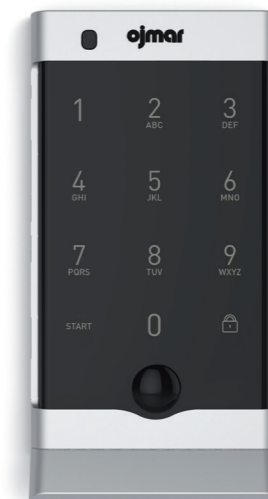
OCS®SMART Plata Tirador