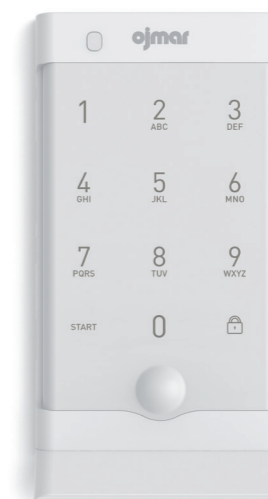
OCS®SMART Blanco Tirador